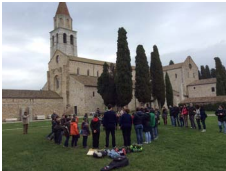
LE PROMESSE DEI LUPETTI

La catechesi sul battesimo ha permesso a capi, lupetti ed esploratori non solo di riappropriarsi del loro battesimo e di localizzare il luogo storico dove è avvenuto ma anche, con la visita al battistero di Aquileia, di codificare nella loro memoria il luogo da dove la fede cristiana si è diffusa nelle nostre terre. Non è parso vero poi di cogliere l'occasione per celebrare le promesse scout che altro non sono se non il tentativo di concretizzare nella vita quelle battesimali.