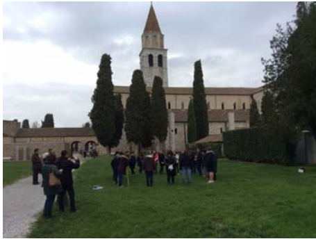
LE PROMESSE DEGLI ESPLORATORI.

Pertanto, dopo aver rinnovato nel battistero di Aquileia le promesse battesimali si è dato seguito a quelle associative sul prato adiacente alla Basilica.