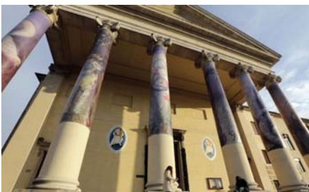
facciata della cattedrale con la porta santa

Oggi, la nostra Collaborazione Pastorale, compirà il pellegrinaggio alla Porta Santa della Misericordia nella Cattedrale di Treviso.