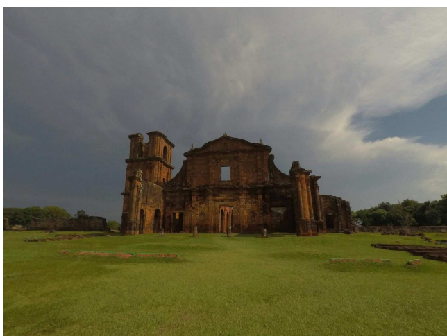
Foto dal Brasile....

In altre parole, se l'uomo crede di poter decidere autonomamente cosa è bene e cosa è male riesce a produrre solo enormi disastri che si ritorcono contro tutta l'umanità. Solo la ricerca del bene comune può dare i veri confini della "buona" ricchezza, evitandoci di cadere nella tentazione dell'idolatria o dell'ideologia.