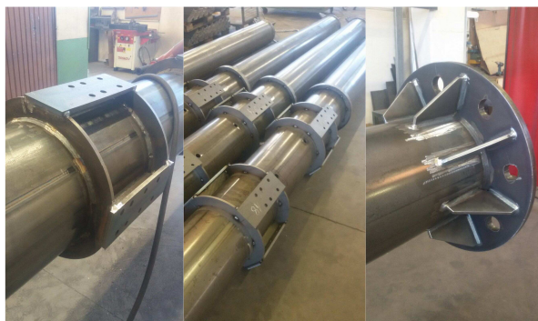
(Le colonne portanti in fase di realizzazione.)

Nulla a confronto con quello che si trovava a San Biagio di Callalta o San Donà di Piave, dove ero parroco prima: bombe inesplose della prima e della seconda guerra mondiale.